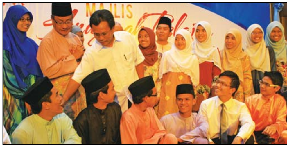
MENTERI Kemajuan Luar Bandar dan Wilayah Datuk Seri Shafie Apdal beramah mesra bersama para pelajar di majlis Anugerah Pelajar Cemerlang SPM 2010 MRSM, di Kuala Lumpur baru-baru ini.

Ia dilaksanakan dengan berlandaskan prinsip pendidikan pintar cerdas dan pendekatan